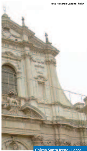
Chiesa Santa Irene - Lecce

Fine inchiesta – le precedenti puntate sono state pubblicate sui numeri del 9, 16, 23, 30 gennaio e 6, 13, 20, 27 febbraio e 6, 13 marzo.